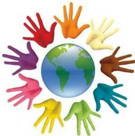
Рис. 1. Толерантность как дружба и взаимопонимание между людьми разных стран и культур

Международный день толерантности (16 ноября) – это праздник, в который и дети, и взрослые учатся быть мудрыми, терпимыми, милосердными, сострадательными и прощающими.